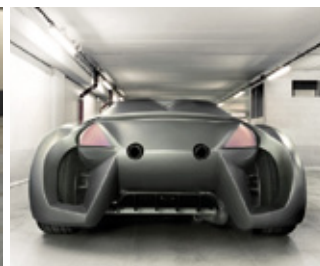
Réalisation 2010 pour le mondial de l'automobile à Paris